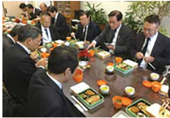
安価でおいしく、栄養バランスの良い給食へ。

http://www.yhkomei.com/ E-mail:shikai@yhkomei.com 公明党横浜市議員団 〒231-0017 横浜市中区港町1-1 TEL.671-3023 FAX.681-2060